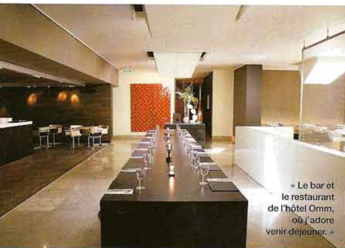
« Le bar et le restaurant de l'hôtel Omm, où j'adore venir déjeuner. »