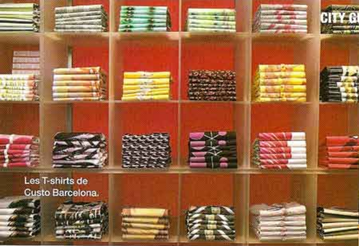
Les T-shirts de Custo Barcelona.