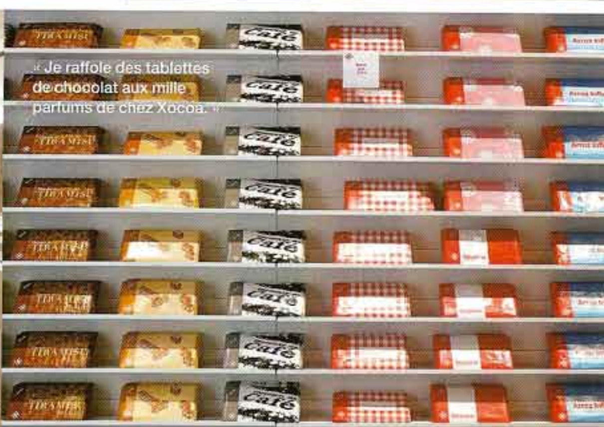
« Je raffole des tablettes de chocolat aux mille parfums de chez Xocola. »